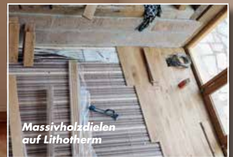
Massivholzdielen auf Lithotherm