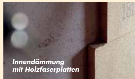
Innendämmung mit Holzfaserplatten

„jede Dachkonstruktion bietet andere tolle Möglichkeiten ...“