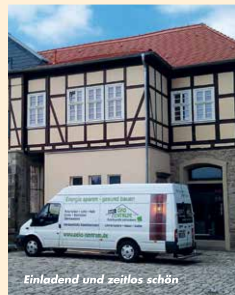
Einladend und zeitlos schön