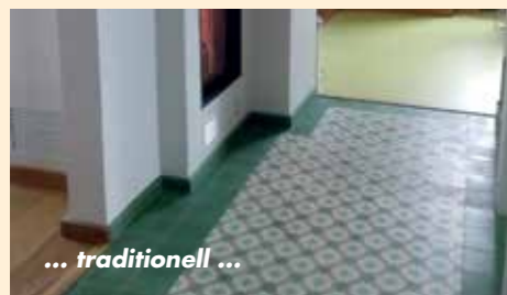
... traditionell ...