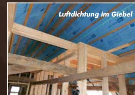
Luftdichtung im Giebel

„jede Dachkonstruktion bietet andere tolle Möglichkeiten ...“