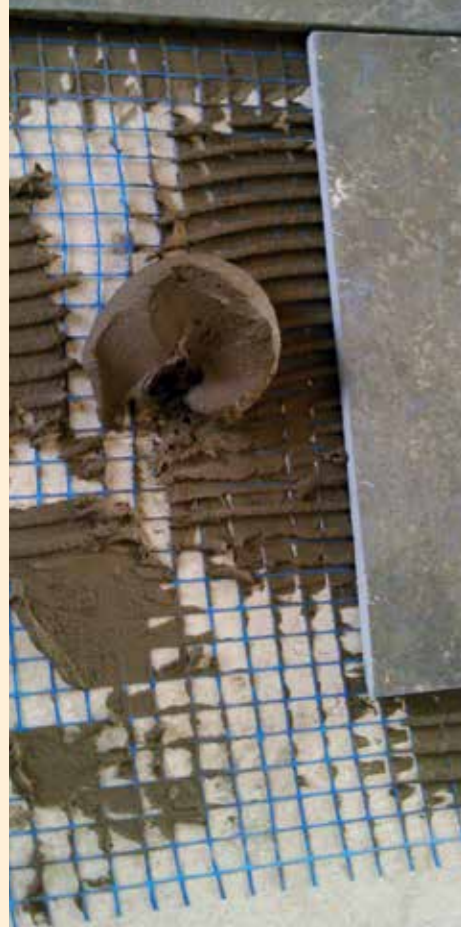
Fliesenkleber im Netz für den Spannungsausgleich bei Temperaturschwankungen

Fliesen können in Farbe und Form sehr schlicht angeordnet werden, doch unsere Handwerker machen daraus lieber spannende und raumprägende Gestaltungselemente – auch außen!