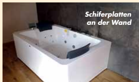
Schieferplatten an der Wand