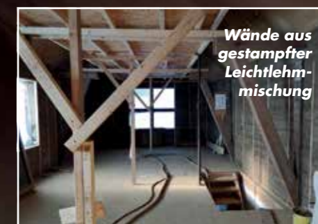
Wände aus gestampfter Leichtlehm-mischung