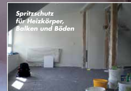
Spritzschutz für Heizkörper, Balken und Böden