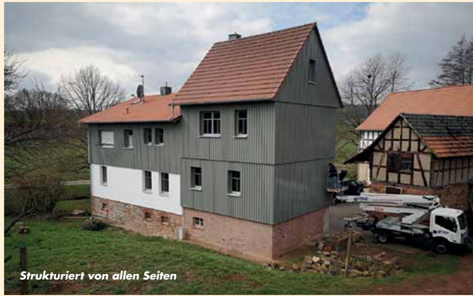
Strukturiert von allen Seiten

Natürlich sind Häuser und Scheunen keine Menschen, doch spürt man dennoch ein wohliges Gefühl, wenn man ein baubiologisch gut renoviertes altes Fachwerkhaus betritt. Und dieses Versprechen sollte man einem Haus schon von außen ansehen.