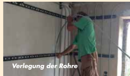
Verlegung der Rohre