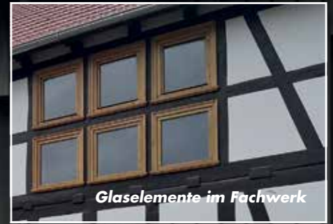
Glaselemente im Fachwerk