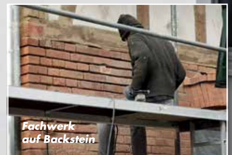
Fachwerk auf Backstein