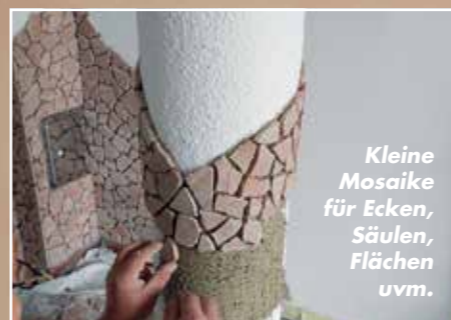
Kleine Mosaik für Ecken, Säulen, Flächen uvm.