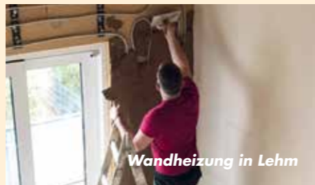
Wandheizung in Lehm