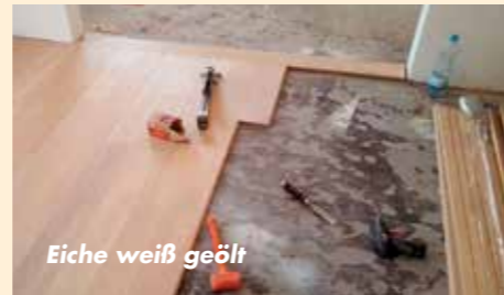
Eiche weiß geölt