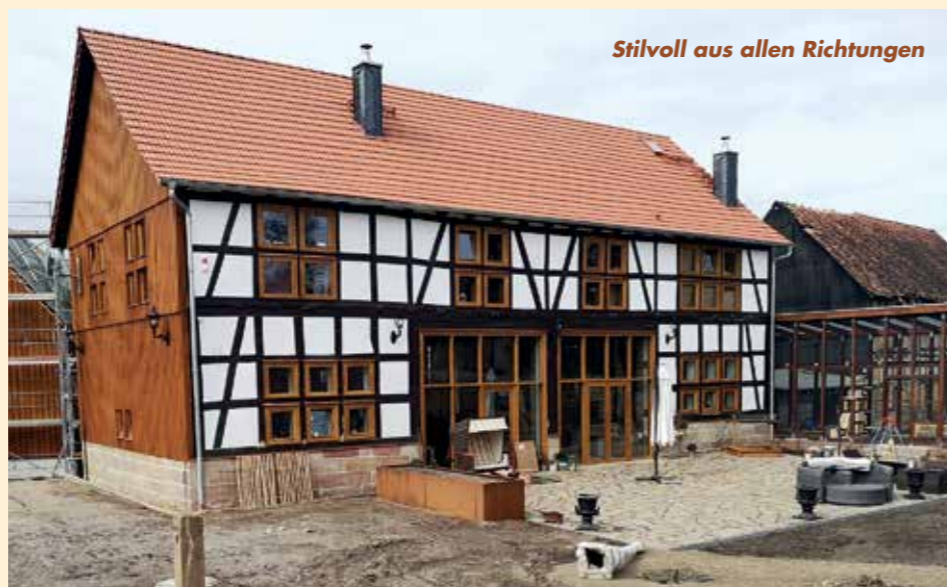
Stilvoll aus allen Richtungen