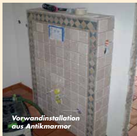
Vorwandinstallation aus Antikmarmor