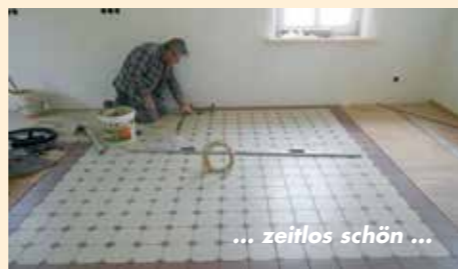
... zeitlos schön ...