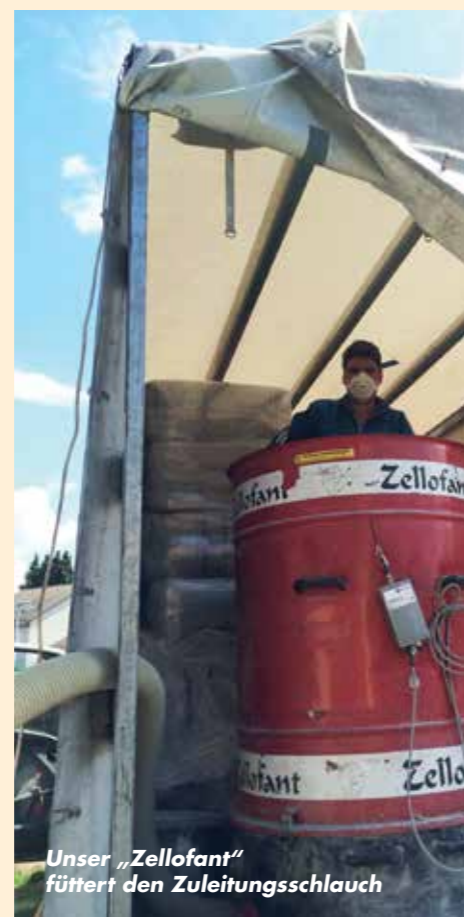
Unser „Zellofant“ füttert den Zuleitungsschlauch