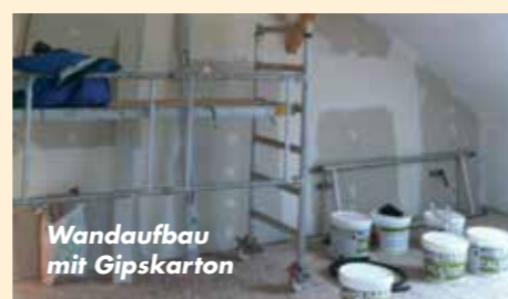
Wandaufbau mit Gipskarton