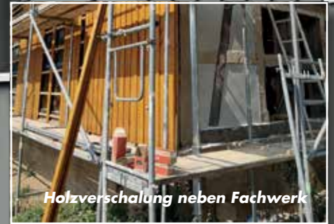
Holzverschalung neben Fachwerk