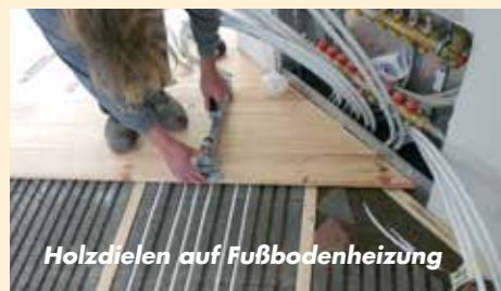
Holzdielen auf Fußbodenheizung