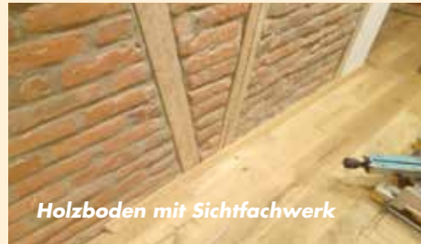
Holzboeden mit Sichtfachwerk