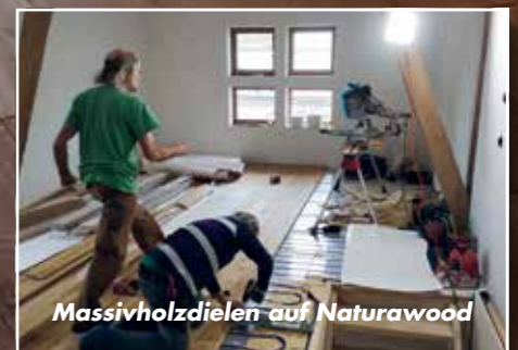
Massivholzdielen auf Naturawood