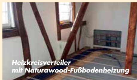
Heizkreisverteiler mit Naturawood-Fußbodenheizung