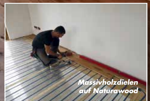
Massivholzdielen auf Naturawood