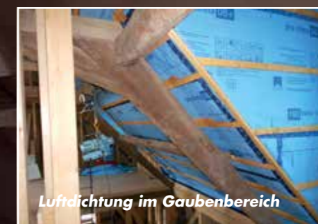
Luftdichtung im Gaubenbereich