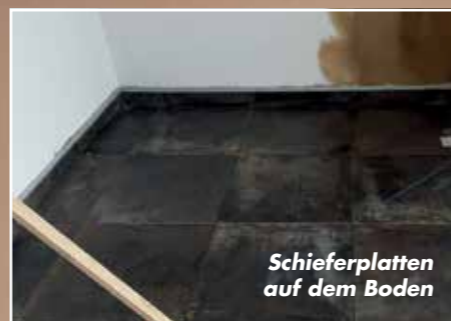
Schieferplatten auf dem Boden