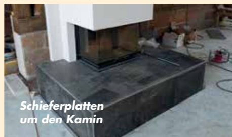
Schieferplatten um den Kamin

Wir freuen uns auf Ihre neue Aufgabenstellung an das Öko Bau-Zentrum!