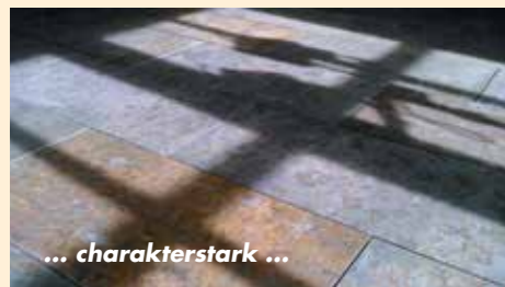
... charakterstark ...