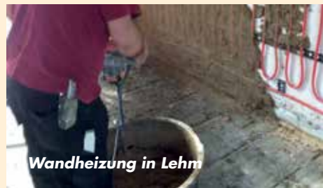
Wandheizung in Lehm

Einbau einer Innenwanddämmung. Genauso können wir Ihnen auch eine warmwassergeführte Fußbodenheizung anbieten, die wir für verschiedene Aufbauhöhen in unterschiedlichen Varianten im Programm haben. Sprechen Sie uns für Ihr Projekt an. Den passenden Holzboeden haben wir für Sie auch im Programm.