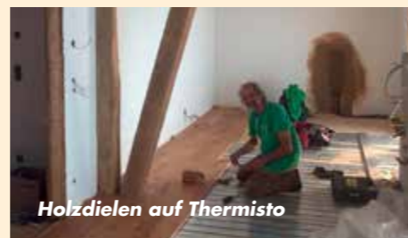
Holzdielen auf Thermisto