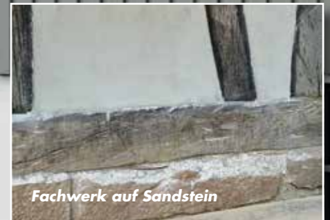
Fachwerk auf Sandstein