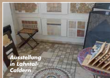
Ausstellung in Lahntal-Caldern